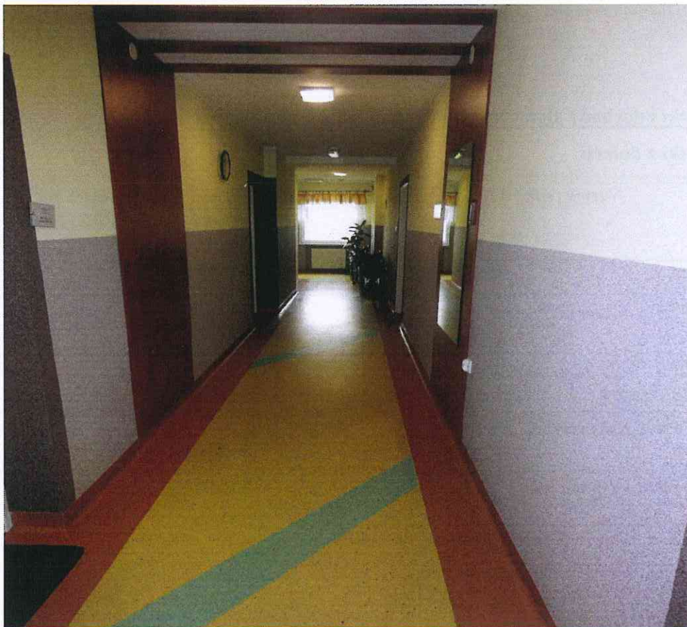
Korytarz po remoncie

Średnia stawa żywieniowa wynosiła 7,50 zł. Miesięczny koszt utrzymania mieszkańca wynosił 2.563,13 zł . Na dzień 31 grudnia 2014r. w domu przebywało 56 mieszkańców. Mieszkańcy wszystkich Domów Pomocy Społecznej brali udział w imprezach integracyjnych „Inne Światy”, „Gwiazdka dla Wszystkich”.