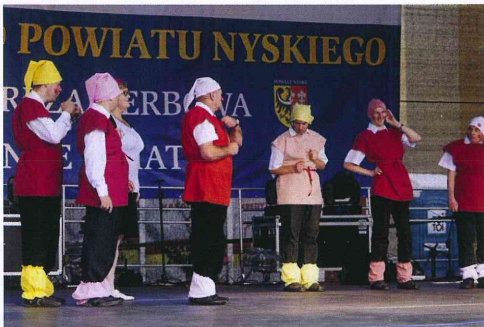
Impreza Herbowa „Inne Światy”