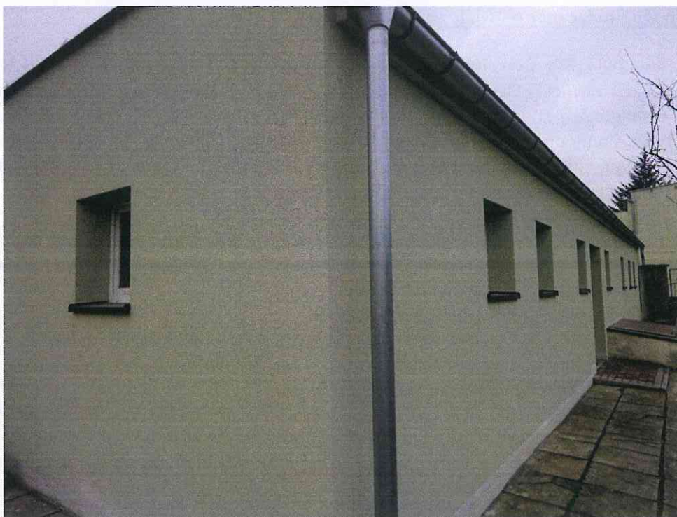
Budynek gospodarczy po remoncie