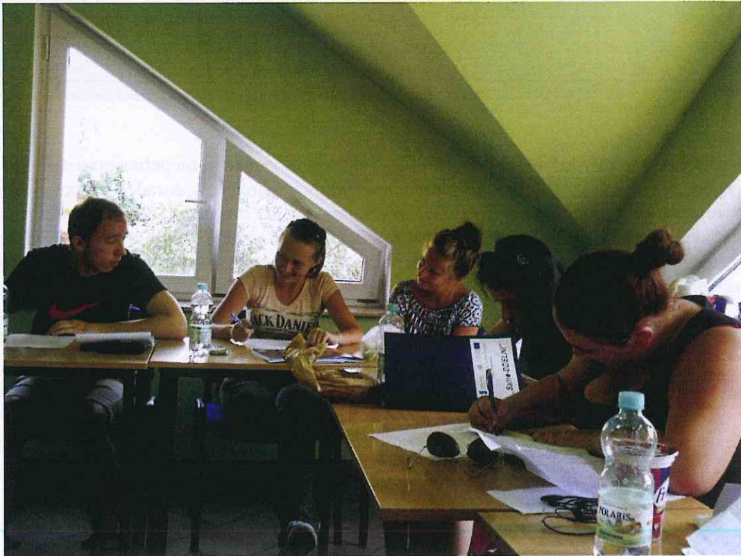
Zajęcia podczas kursu przedstawiciel handlowy z prawem jazdy kat. B