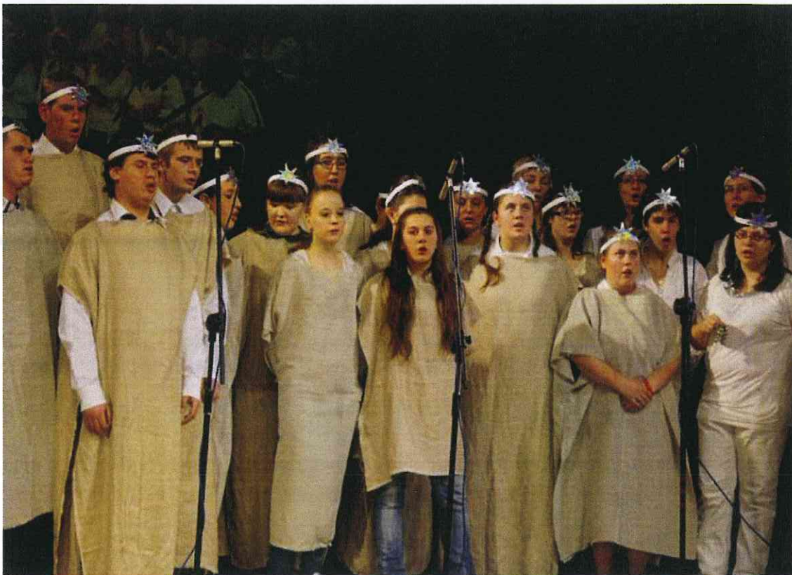
Impreza integracyjna „Gwiazdka dla Wszystkich”

Na dzień 31.12.2014r. PCPR zatrudniało 21 pracowników na 20 etatach, staż w ciągu roku odbywało 6 osób w tym 1 osoba w ramach stażu z Powiatowego Urzędu Pracy.