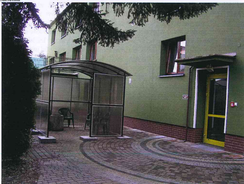
Wiata służąca jako palmarna