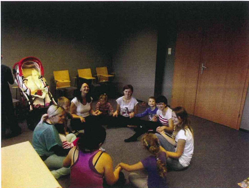
Uczestniczki szkolenia z zakresu pierwszej pomocy