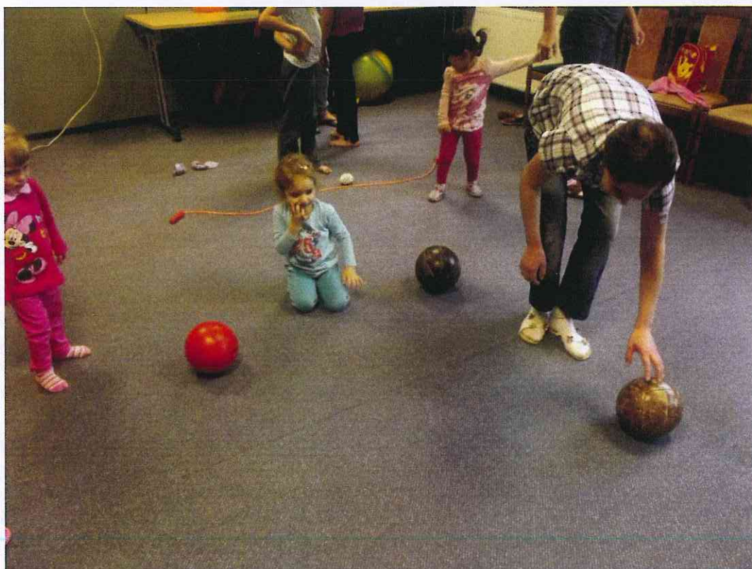
Zajęcia rekreacyjne dla dzieci