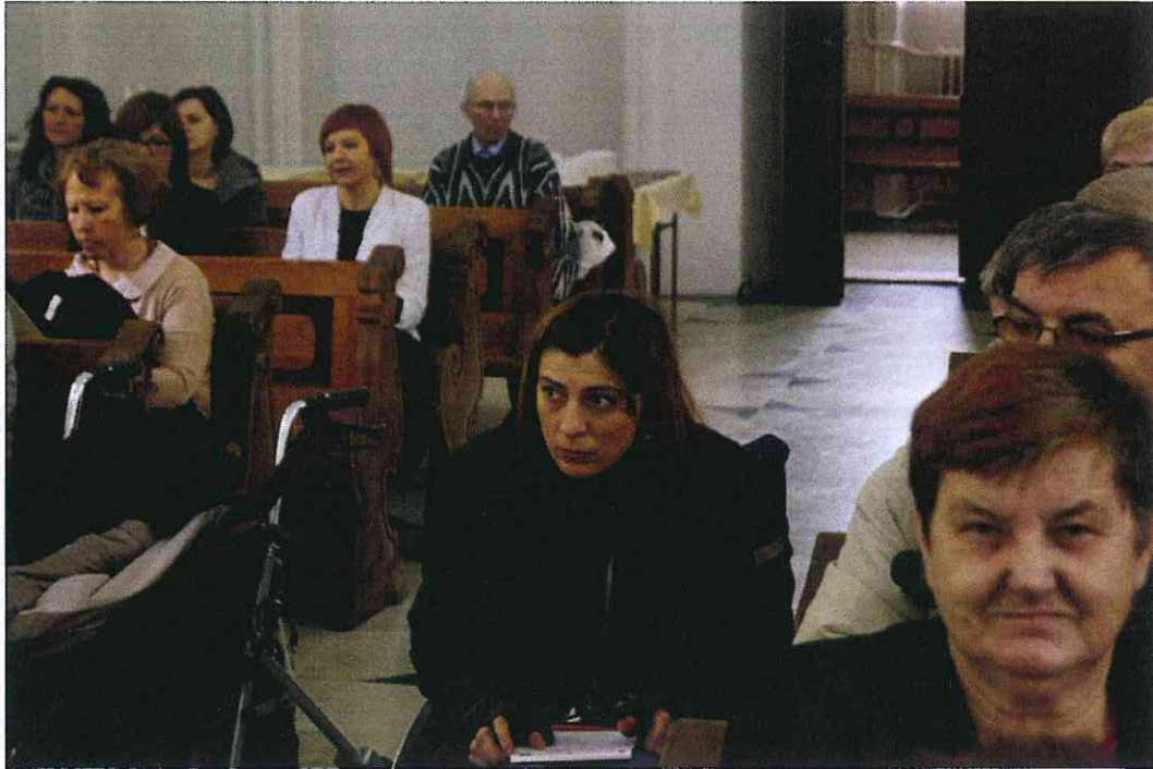
Konferencja podsumowująca 12.12.2014r.