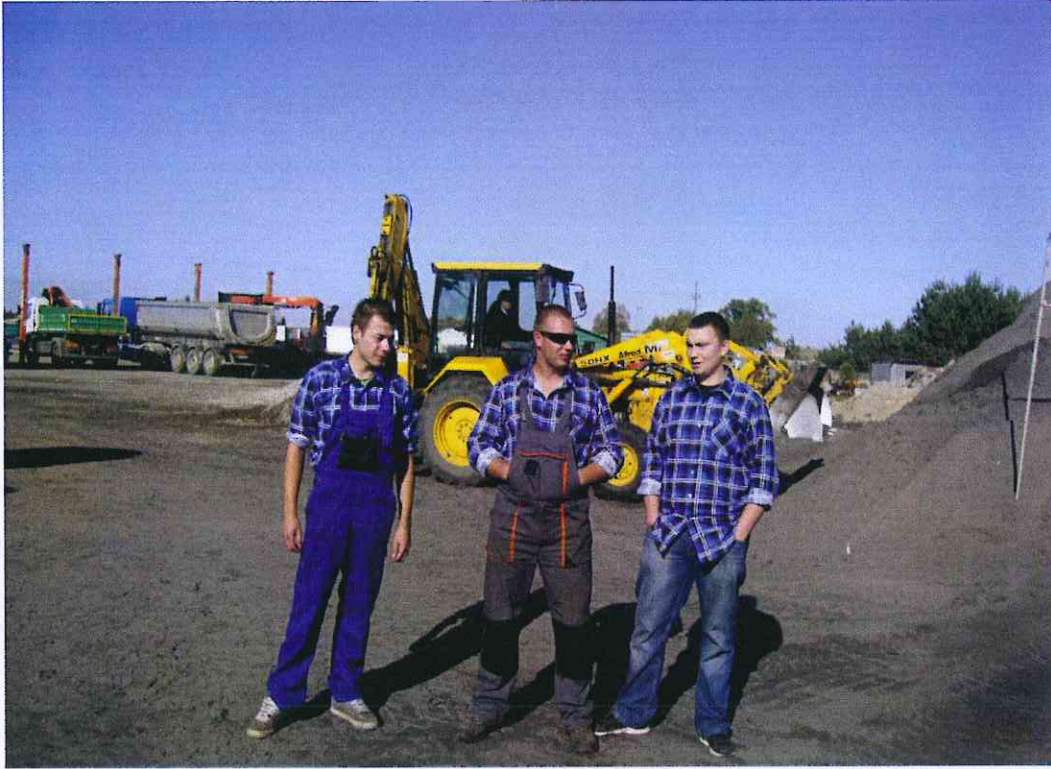
Zajęcia praktyczne podczas kursu operatora koparkoładówek kl. III