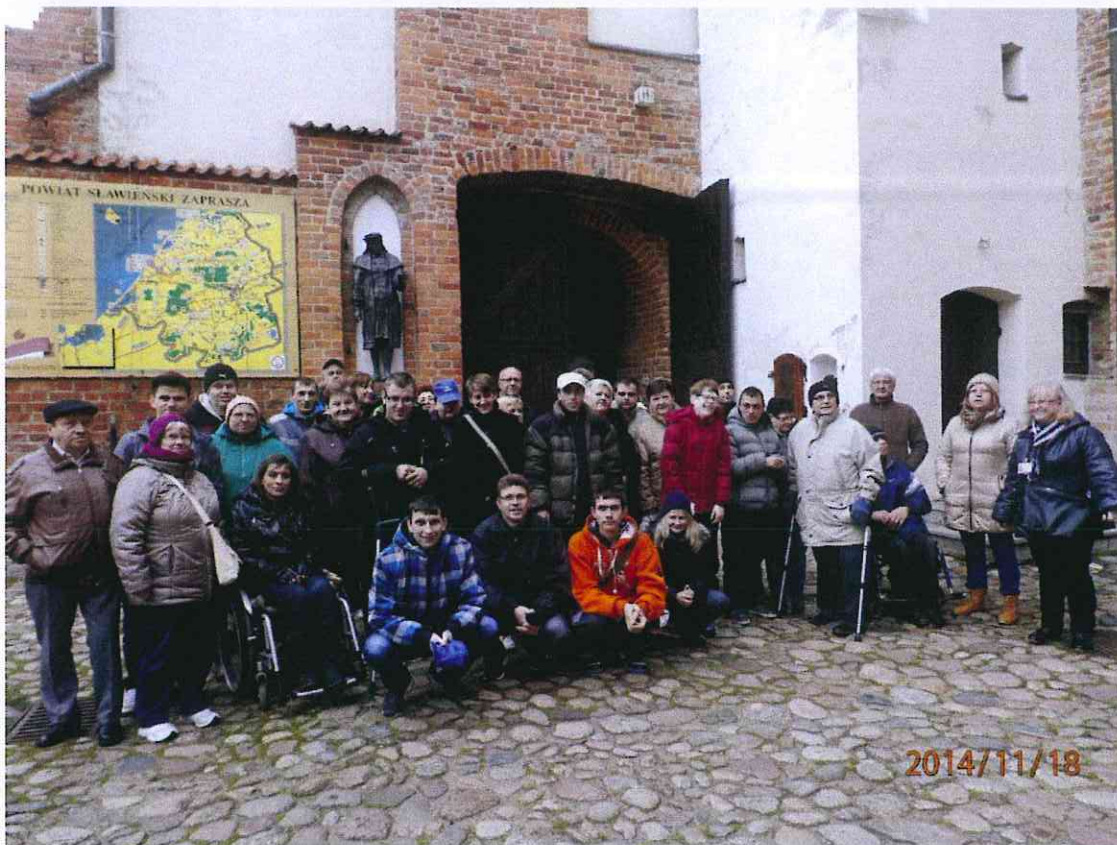
Uczestnicy turnusu rehabilitacyjnego w Jarosławcu

Osoby niepełnosprawne wzięły udział m.in. w spotkaniach indywidualnych z doradcą zawodowym i psychologiem, turnusie rehabilitacyjnym z kursem komputerowym, treningiem radzenia sobie ze stresem i warsztatami aktywnego poszukiwania pracy.