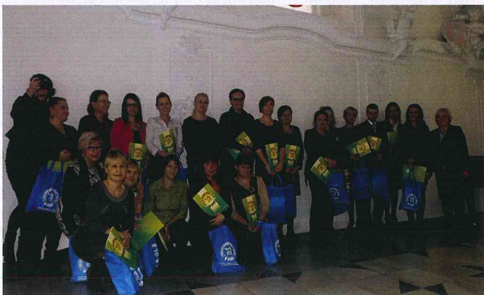
Dzień Pracownika Socjalnego