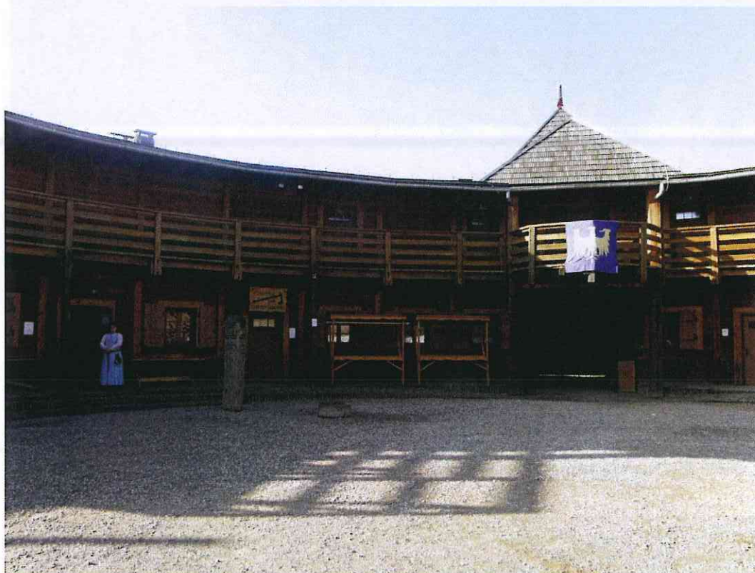
Spółdzielnia socjalna GRÓD

W ramach działań o charakterze środowiskowym zorganizowano wyjazd studyjny dla 54 osób niepełnosprawnych wraz z opiekunami do spółdzielni socjalnej „Gród” w Biskupicach.